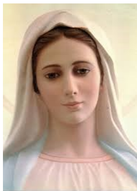
María Reina de la Paz. Ruega por nosotros