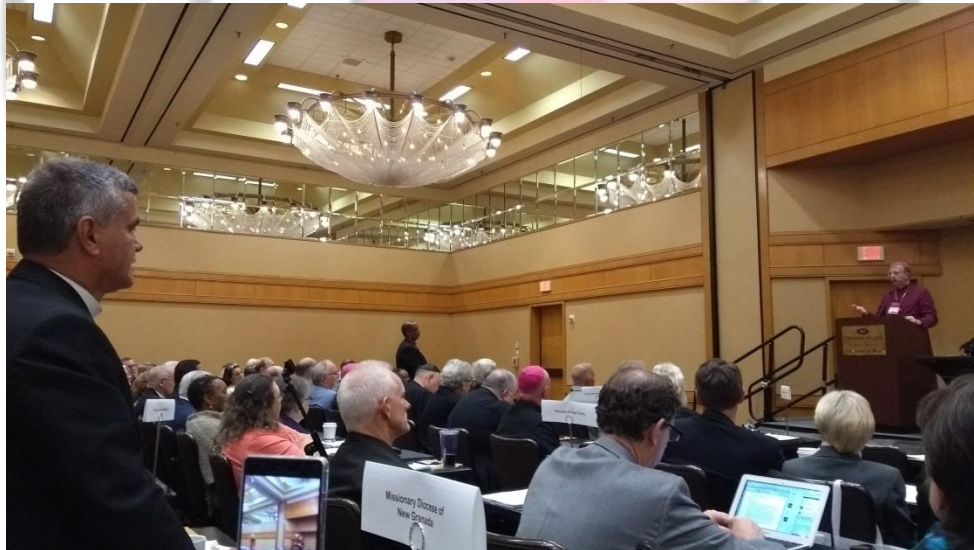
Reconocimiento Séptimo aniversario de la Ordenación Episcopal

Personería Jurídica Especial Eclesiástica. 927/95. Ministerio del Interior de la República de Colombia