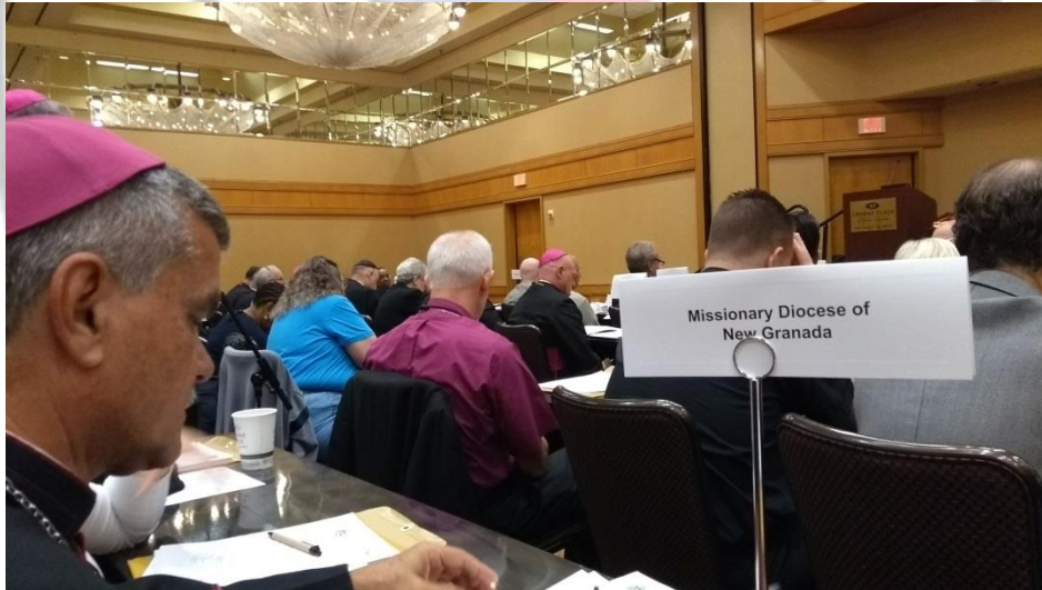
Asamblea Sínodo Conjunto 2017 ACC

Personería Jurídica Especial Eclesiástica. 927/95. Ministerio del Interior de la República de Colombia