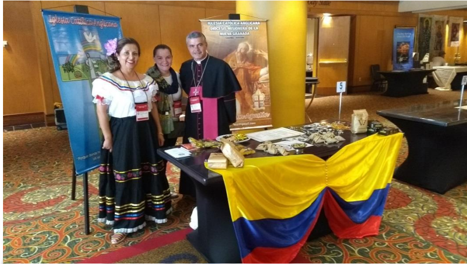
Stand de la Diócesis de la Nueva Granada