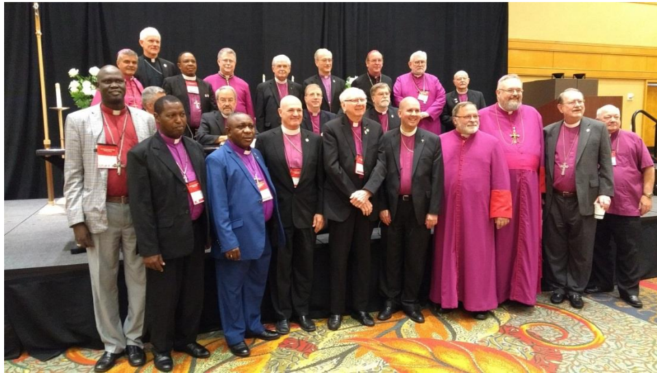
Colegio de Obispos 2017